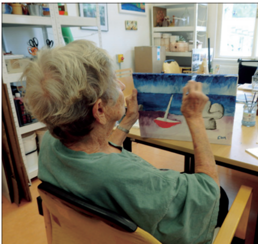
Projekt dílny CDA – malba kopií slavných obrazů

Denní stacionář měl v roce 2019 maximální kapacitu 5 míst. Evidováno bylo 11 smluv, 3 smlouvy byly během roku ukončeny a 2 nové uzavřeny.