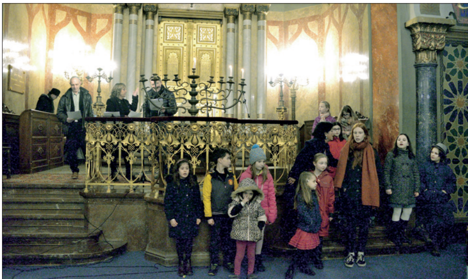
Svátky světel v Jeruzalémské synagoze