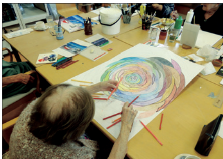
Projekt dílny CDA – malba kopií slavných obrazů