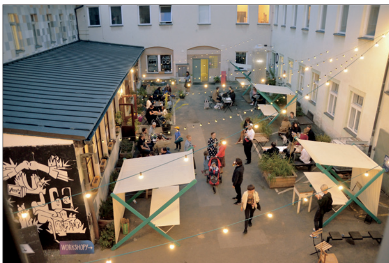
Judafest 22. září 2019

ŽOP zlepšuje komunikaci se svými členy – od roku 2018 jsou prostřednictvím e-mailu informováni elektronickou formou – dostávají každý týden newsletter: Kulturní, společenské a náboženské akce.