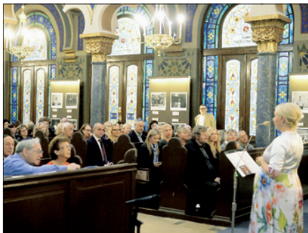
KDP EZRA zorganizovala benefiční koncert, jehož výtěžek byl použit na zlepšení služeb klientům

V roce 2019 bylo v péči KDP Ezra 144 klientů. Těmto klientům byly poskytovány služby sociální, zdravotní a ergoterapeutické.