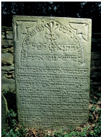
Židovský hřbitov v Dubu u Prachatic

Nový židovský hřbitov (NŽH) – činnost technické správy v roce 2019 byla značně rozsáhlá. Stejně jako v roce předchozím byla zaměřena především na záchranu náhrobků ve staticky havarijním stavu, pokračování celkové revitalizace zeleně a také na dlouhodobý projekt označování opuštěných hrobů. Část nákladů souvisejících s těmito pracemi byla kryta z dotací a darů v úhrnné výši 1,39 tis. Kč (MČ Praha 3, MHMP a soukromé osoby). Mezi ostatní stavební akce patřilo např. dokončení opravy západní části ohradní zdi, zpracování návrhu úprav pro snížení vlhkosti základového zdiva obřadní síně včetně opravy doživající střešní krytiny, zpracování projektu celkové rekonstrukce obytné vilky v urnovém oddělení, záměna elektrického akumulárního vytápění za plynové v kancelářích správy hřbitova, oprava a doplnění odpočinkových laviček a další. Souběžně s tím probíhalo množství menších akcí, které měly povahu údržby a z větší části byly realizovány vlastními