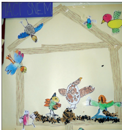
Práce dětí z Programu Lauderovy školky v Praze

Spolupráce s rodiči se uskutečňovala průběžně během školního roku, rodiče byli týdně informováni o výchovném programu a výuce hebrejštiny, participovali na některých činnostech (Chanuka, Purim, oslavy narozenin).