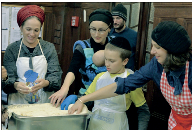
Společný šábes 14. listopadu 2019 – pečení chaly

Noviny stručně informovaly o významných projektech, přinášely příspěvky k aktuálním politickým otázkám i informace o Federaci židovských obcí v ČR. Podrobně referovaly o výsledku hospodaření ŽOP za uplynulý rok a o schváleném rozpočtu na rok následující. Pravidelně vycházely informace o nových knihách, zajímavých výstavách a divadelních představeních. Šéfredaktorem byl Petr Balajka.