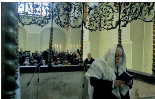
Pinkasova synagoga 8. března 2019. Tryzna za rodinný tábor v Osvětimi-Březince