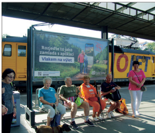
Klub zdraví – výlet do Radotína

Tým sociálního oddělení pracoval ve složení: vedoucí střediska, čtyři sociální pracovníce, psychoterapeutka, finanční asistentka, koordinátorka dobrovolníků, ergoterapeutka, dvě fyzioterapeutky, pracovní asistenti, pracovní konzultantka.