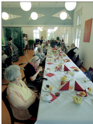
Oslava Roš hašana v DSPH