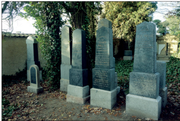
Židovský hřbitov v Dobříši

Mezi nejvýznamnější stavební akce roku 2019 u komerčních objektů patří bezesporu