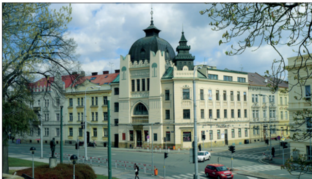
Synagoga v Hradci Králové

Původně plánovaný rozpočet SBH pro rok 2019 nebyl překročen a ve výsledku došlo dokonce k úspoře ve výši 360 000 Kč .