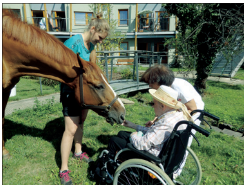
Terapeutické využití koně na Hagiboru

V provozu byly webové stránky DSPH https://www.kehilaprag.cz/cs/dsp-hagibor .