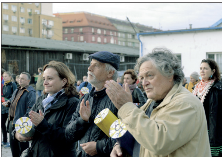
Bubnování pro Bubny, 16. 10. 2019