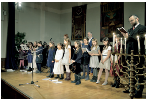
Chanuka na židovské obci – dětský sbor Lauderových škol