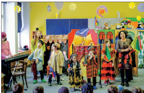
Divadlo Feigele – purimová oslava v DSPH