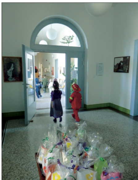
Oslava Purimu na Hagiboru – předávání dárečků