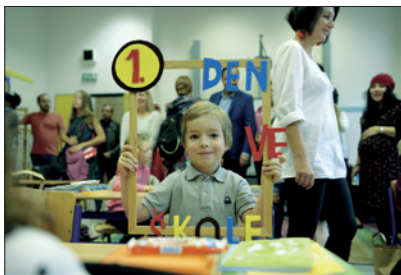
První den ve škole – vítání prvňáčků

Také v roce 2019 dotovala ŽOP významným způsobem činnost Lauderových škol (27 % rozpočtu školy). Lauderovy školy představují jedinečný vzdělávací projekt určený dětem, žákům a studentům se zájmem o výchovu v duchu židovství. Základní škola vznikla v roce 1997, od roku 1999 existuje gymnázium a od roku 2009 mateřská škola. V září 2016 byl obnoven druhý stupeň ZŠ. Výuka na všech vzdělávacích stupních probíhá podle vlastního školního vzdělávacího programu Le chajim, vycházejícího z rámcových vzdělávacích programů pro předškolní, základní a gymnaziální vzdělávání, navíc obohacených o židovská specifika – židovskou výchovu a hebrejštinu. Na jaře 2019 začala rekonstrukce budovy – přístavba 4. patra. Na konci roku 2019 bylo v MŠ, ZŠ a v gymnáziu Lauderových škol 362 žáků a studentů.